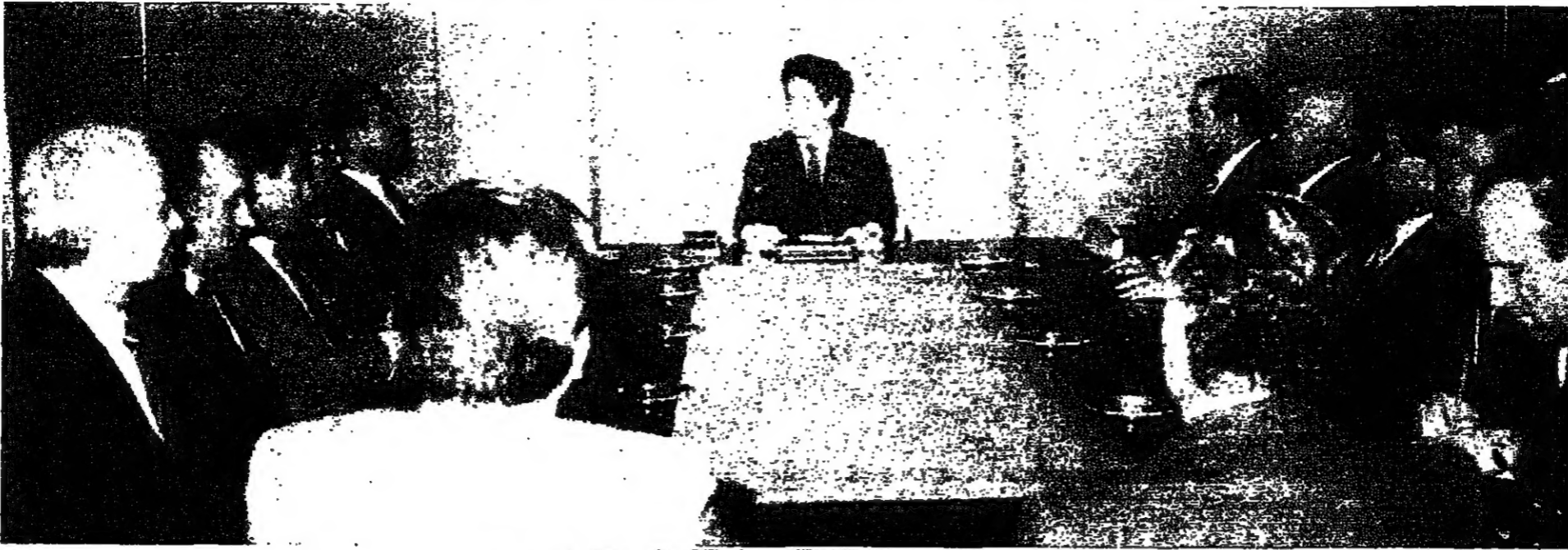
الرئيس الجميل خلال لقائه مع وفد تقنية محلي بيروت